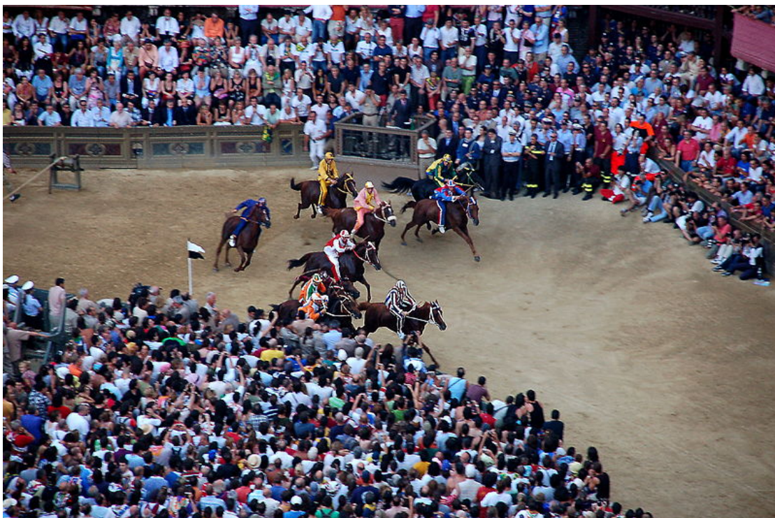
Abb. 1. Der Palio von Siena als fanatische Praxis | Illustr. 1. Il Palio di Siena come prassi fanatica

La quarta edizione delle lettere aperte si occupa dell'attuale tema del fanatismo e della sua rappresentazione nell'ambito della letteratura italiana. Il concetto di fanatico può essere ricondotto a due elementi: da un lato al latino fanum – il 'tempio', dall'altro alla parola araba fana , nel senso di 'distruzione'. Essendosi perso il riferimento religioso durante l'Illuminismo, sostituito da connotazioni politiche, la religione diventa di nuovo cruciale per il fondamentalismo idealistico a partire dal Risorgimento. Il fanatismo rafforza il proprio modo di essere e di pensare per renderli gli unici validi, svalutando a priori quanto è diverso. Questo processo è accompagnato da un gesto di onnipotenza che si codifica attraverso una specifica semiotica mediatica.